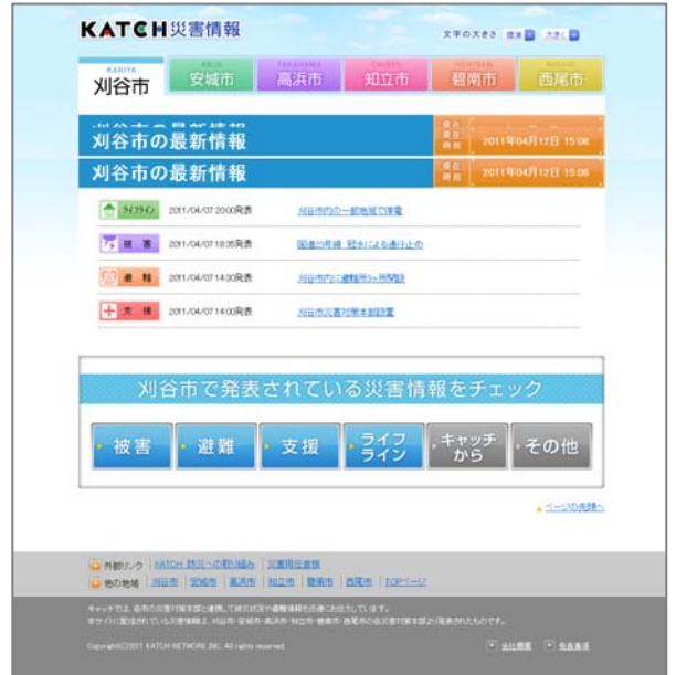
各市の詳細情報ページ